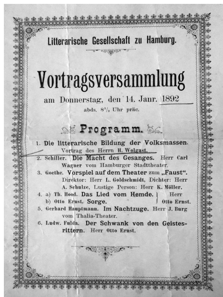
Abb. 4: Programmzettel der Litterarischen Gesellschaft (Wolgast-Nachlass)