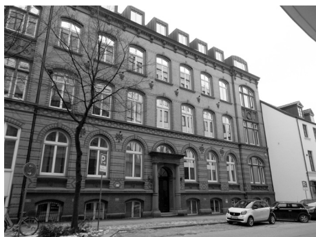
Abb. 2: Bibliothek des JA Hamburg. Um 1900 im Gebäude der damaligen Armenverwaltung, ABC-Straße.

Vom ersten Geld als Kegeljunge in einer Gastwirtschaft kaufte sich der heranwachsende Heinrich Reclam-Hefte. 8 Die frühe Lektüre aus Zeitschriften wie der Gartenlaube beeinflusste den schriftlichen Ausdruck des Schülers, wie er rückblickend schreibt: „Schiller als erster hob mich“ (Wolgast 1908a, 205). Später erschloss sich der Vielleser das Persönliche in Dichtungen von Klaus Groth und anderen wie auch von Gustav Falke, dessen Nachbar der junge Lehrer zeitweise war. Der Großstädter von Hamburg und Altona erfreute sich an dargebotener Musik, besuchte Theatervorstellungen und studierte Kunstwerke in Museen. Sein Kunstverständnis erarbeitete sich der (künstlerisch wohl nicht oder nur dichterisch dilettierende) Laie aus Vorträgen und Konversation, der populär-ästhetischen Zeitschrift Kunstwart und dem Selbststudium in Bibliotheken.